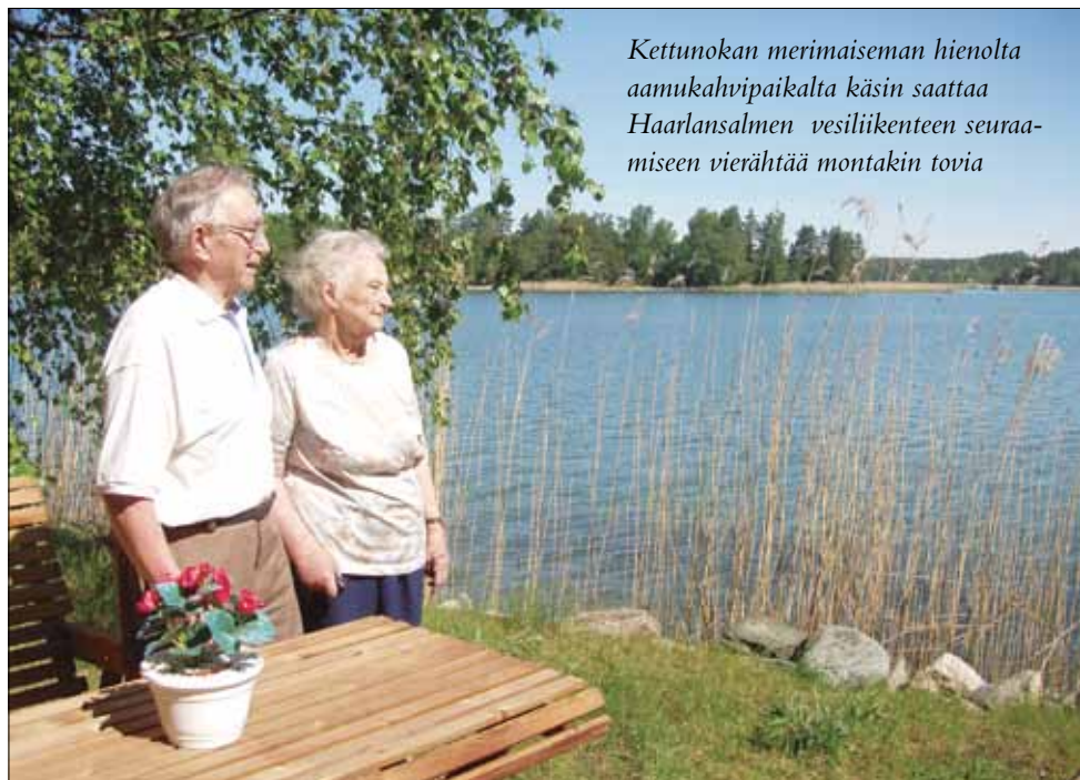
Kettunokan merimaiseman hienolta aamukahvipaikalta käsin saattaa Haarlansalmen vesiliikenteen seuraamiseen vierähtää montakin tovia

Kakskerta oli aikanaan nimenomaan kesäasukkaiden saari. Kakskertalaiset isännät harrastivat poikkeuksellisen ahkerasti huviloitten tai muitten tilojen vuokrausta kesävieraille. Myös Kettunokka osallistui tähän kesävieraitten ”hyyräämiseen”. Talon valmistuttua sitä