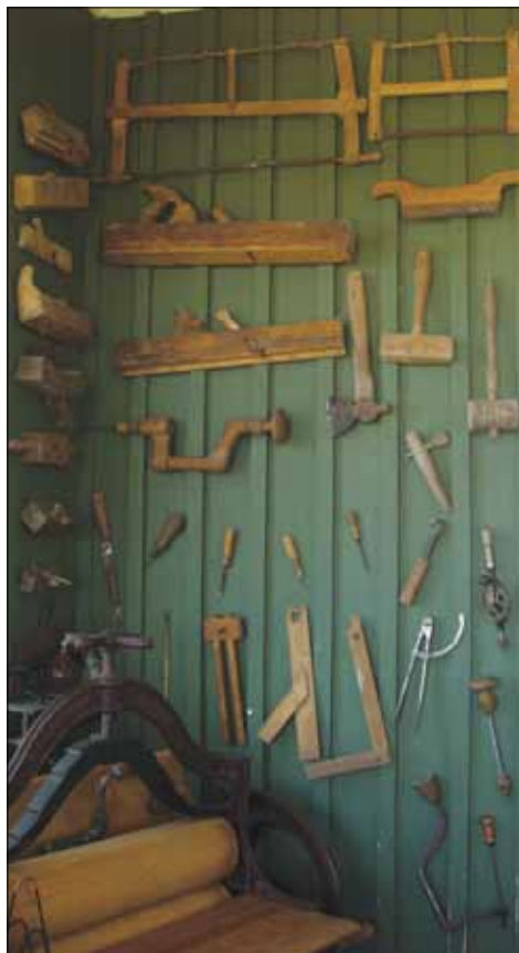
Vilpolassa talon entinen ulkoseinä toimii taustana taideteosmaiselle puutyökalukokoelmalle