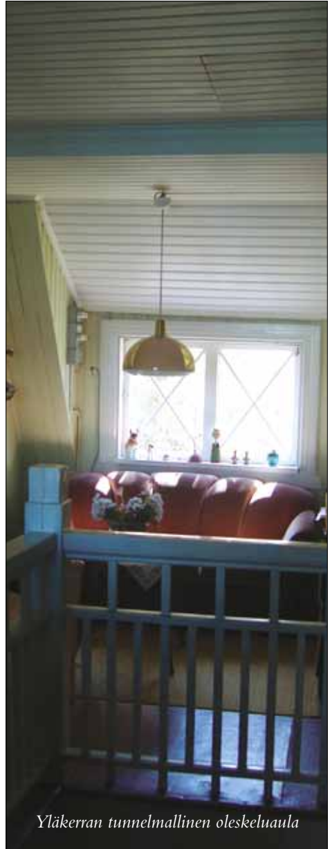
Yläkerran tunnelmallinen oleskeluauula