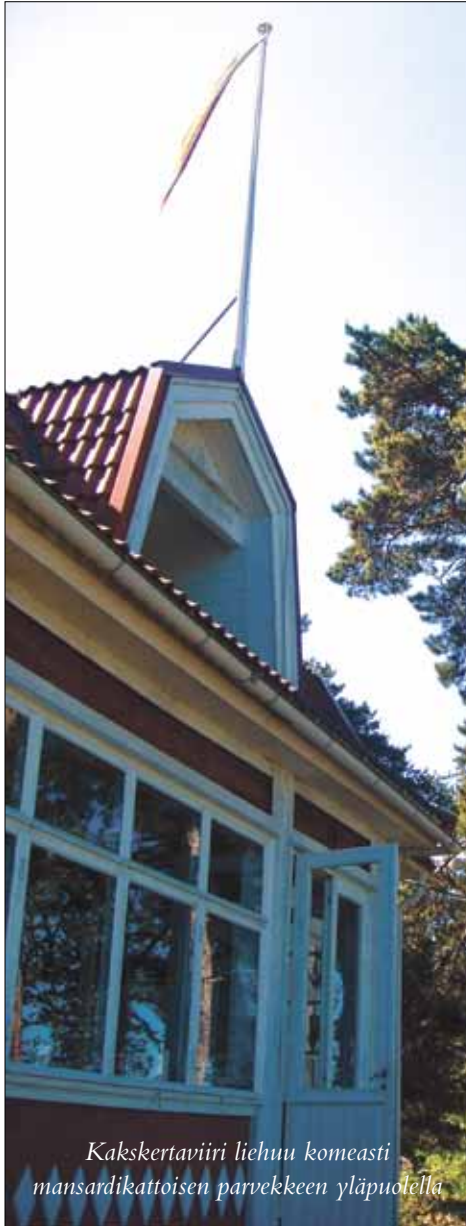
Kakskertaviiri liehuu komeasti mansardikattoisen parvekkeen yläpuolella

jatkaa entisellään. Se tarjoaa yhä yhtä viihtyisän kesäympäristön asukkailleen sukupolvesta toiseen.