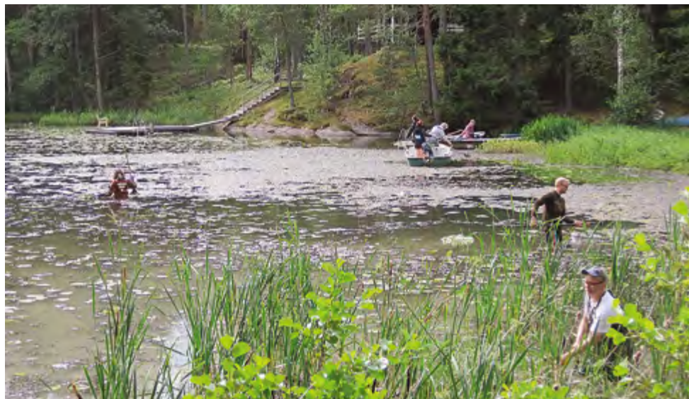
Levämassan keräämistä Kampinlahdella.

Kaks Kerranjärven neuvottelukunta järjesti 19. elokuuta Brinkhallin kartanossa yhteistyössä alueen muiden toimijoiden kanssa Kaks Kerran järvipäivän.