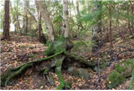
Uunis­pään kesä­mökki­ton­til­la säily­neen tiiliuunin rauniot. Lä­hie­täisyy­dellä on merkkejä myös kol­mesta muusta tiiliuunista ja sa­venotosta.