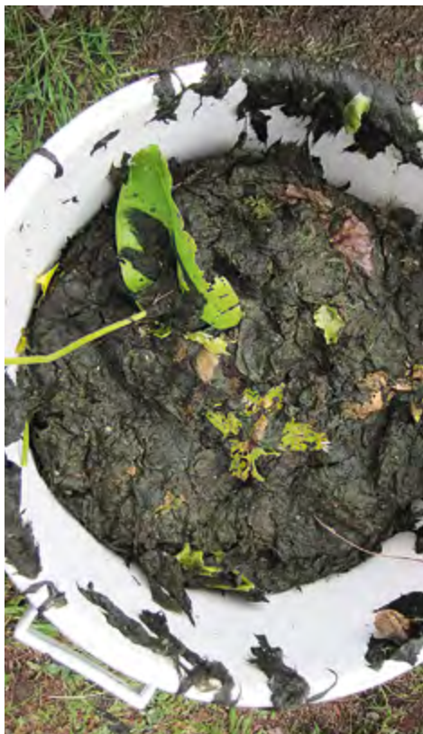
Saavillinen leväsaalista.

Ajatuksena oli koota saaren asukkaita ja eri toimijoita saman pöydän ääreen kuulemaan ja keskustelemaan järven tilasta ja tulevaisuudesta.