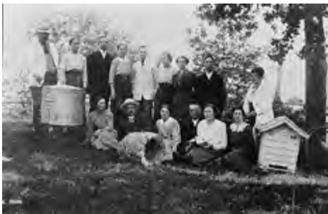
Kakskerran mehiläisseura -yhdistys on ilmeisesti vanhin Kakskerran sittemmin lukuisista yhdistyksistä. Kuva 1900-luvun alusta, Kakskertaseura/Turun museokeskus (TMK).

Museokeskus on digitoinut kuvamateriaalia, josta alla muutama näyte. Niistäkin huokuu se voimakas yhteisöllisyys, joka on aina ollut Kakskerta-Satavassa merkittävä voimavara. Siitä ovat esimerkkeinä lukuisat yhteisöt jo varhaisilta ajoilta. Osa on edelleen voimissaan, joidenkin ohi aika on jo kulkenut.