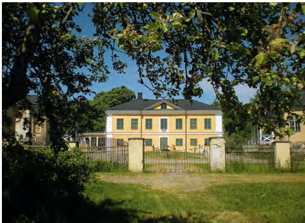
Brinkhallin kartanon ympäristön kunnostusta tehdään suunnitelmallisesti, rakennusten kunnostuksien edetessä, kuva uudistetun hedelmätarhan suunnalta.

Kunnostuksen tavoitteena on saattaa kartanon välitön ympäristö, kaikkine