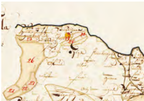
Tiilisalin yksinäinen kruununtorppa on merkitty numerolla 19 vuonna 1696 laadittuun maakirjakartaan. Vertaamalla maaston- ja rannanmuotoja on se paikannettavissa saaren pohjoisosaan, Tiisalantien päähän (nro 22). KA, digitaaliarkisto.

Ainoa Kaks Kerrasta Museoviraston muinaisjäännösrekisteriin merkitty tiilenvalmistuspaiikka on ”Pispanlahti”, Kettuvuoren kaakkoispuoleinen rantaluoto, jonka kesämökkiteiltä Uunispää