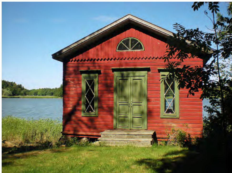
Brinkhallin ympäristön kauniisti kunnostettu uimahuone meren rannalla, hienon lepikon suojassa.

osa-alueineen, rakentamisen ajankohdan edellyttämään tilaan. Varsinainen sisäpihan juhlapiha on saanut jo oikean muotonsa vaikka istutukset odottavat vielä tuloaan rakennusten julkisivujen remontin loppuun saattamisen jälkeen. Eteläinen suuri hedelmäpuutarha on uudistettu ja länsiosan Englantilaisen maisemapuutarhan luonne on selkeästi nähtävillä. Merenrantaan ja uimahuoneelle vievän tien varren kivimuureja on kunnostettu ja lehtoympäristöä on harvennettu ja hoidettu kauniisti. Kunnostusta koko kartanon alueella tehdään pitkäjänteisesti, asiantuntevasti laaditun suunnitelman pohjalta.