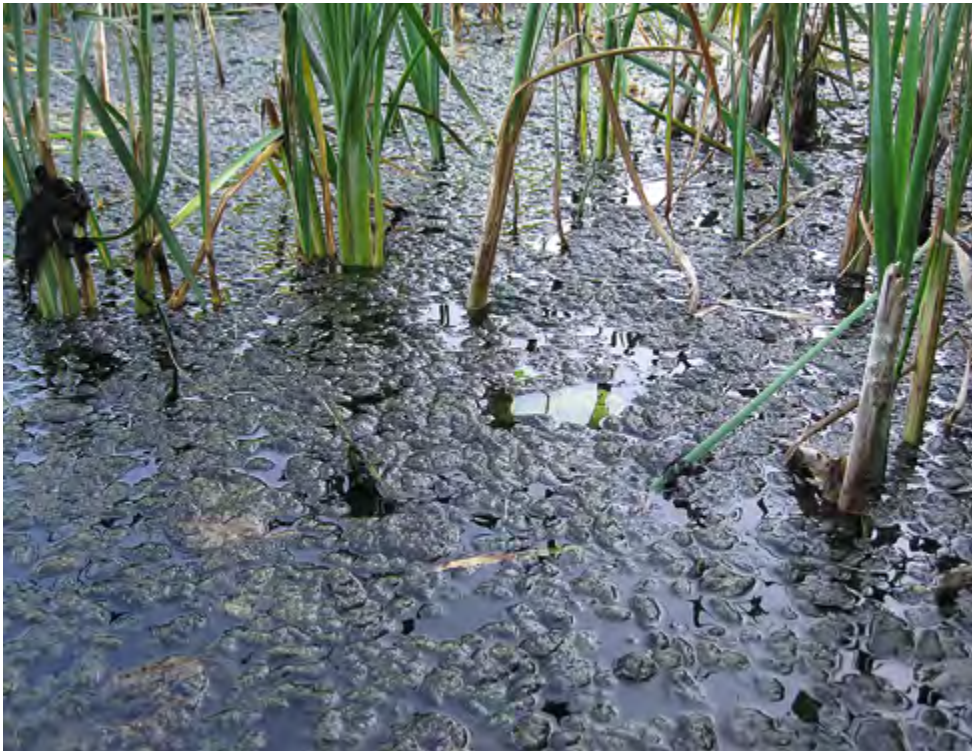
Myrkyttömiä sinilevöpalleroita.

menetelmä olisi imuruoppaus, jossa liete läjitetään geotekstiilituubeihin ja fosfori saostetaan kemiallisesti. Ruopattavaa pinta-alaa on noin 1500 neliometriä, jolloin ruoppausmassoja tulisi noin 300 - 400 kuutiometriä. Työn karkea kustannusarvio on geotekstiilituubien kautta rannalle läjitettynä noin 50 000 €. Kunnostustoimenpiteistä ei toistaiseksi ole päätetty, vaan Kaksikerranjärven neuvottelukunta tutkii vielä muitakin vaihtoehtoja.