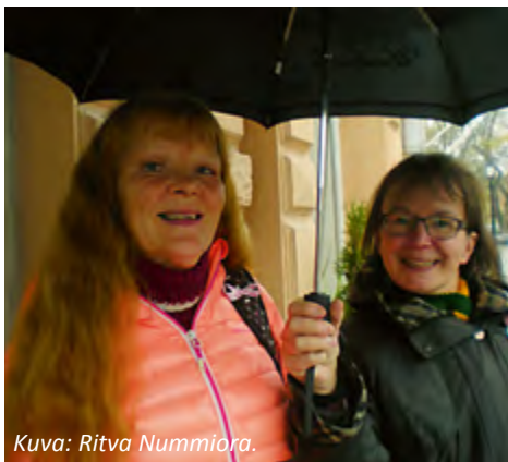
Kuva: Ritva Nummiöra.

Mutta siihen mennessä oli tapahtunut paljon. Elina Mämmin veli asui Turussa ja omisti veneen, jolla seilattiin pitkin poikin saaristoa ja kauemmaksikin. Muina loma-aikoina Elina pyöräili Turku