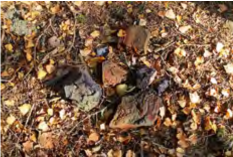
Tiilen­poltosta on aina jäänyt jäl­jelle kuonaa ja polton aikana vioittuneita nk. hylkytiiliä. Uunis­pään ton­til­la niitä on näkyvillä, mutta jäännökset ovat vuosisatojen saatossa saattaneet hautautua maan alle.

Raustvuoren yksinäistalon mailla oleen em. ”tiilialin” uunien käyttöaikaa ei tunneta. Sitä vastoin sanomalehdissä on kirjoituksia Kollin tiiliruukista, joka toimi 1850-1880 -luvuilla. Se sijaitsi mitä ilmeisimmin meren rannassa Varvintien päässä, nykyisen Leponiemen kesämökkitontin tuntumassa, sillä lehti-ilmoituksen mukaan tiiliä laivattiin Rouvaniemen laiturilta. Kollilla on kuitenkin ollut myös toinen tiilenvalmistuspai­kka talon van-