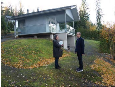
Rantasaunassa on vietetty kauniita kesäiltoja.