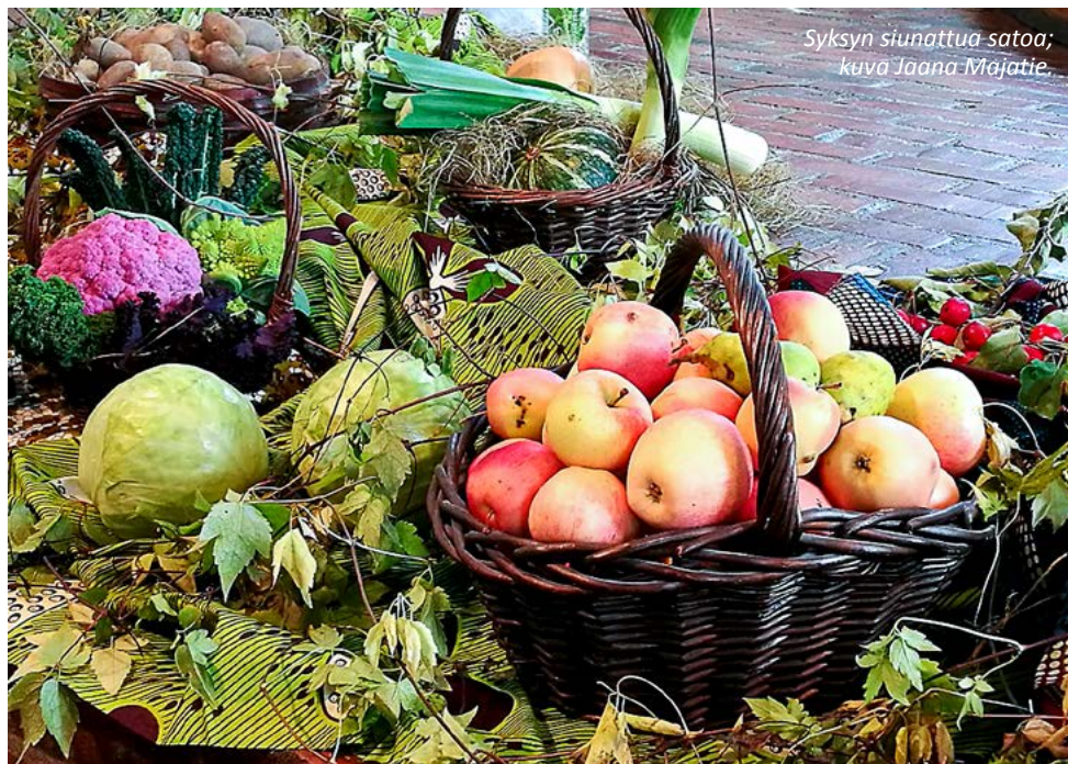
Syksyn siunattua sataa; kuva Jaana Majatie.

Sadonkorjuupäivää vietettiin perinteiseen tapaan Kaksikertatalolla. Tarjolla oli kulttuuri- ja toimintatyöryhmän tekemiä suolaisia syötäviä, joissa teemana olivat yrtyt. Keittiön puolella oli makeita kak-