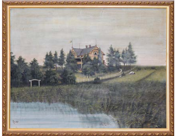
Mäntyniemi