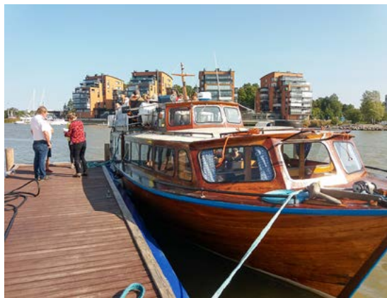
Vesibussi lähdössä, taustalla laivaprofiilin rakennuksia