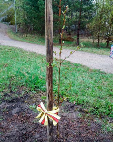
Lepän taimi saa tukea kakskertanauhasta; kuva Ritva Nummiora.

Hirvensalon Arboretumin alueelle. Istutusalue sijaitsee lähellä Wäinö Aaltosen koulua, kevyenliikenteen reitin varrella. Tämä Suomi 100 - Arboretum hanke käynnistyi Suomen täyttäessä 100 vuotta 2017, jolloin arboretumiin istutettiin ensimmäinen puu – tammi. Alueelle saatiin nyt metsävaahtera, puistolehmus, rusokirsikka, hapankirsikka ja valeakaasia. Myös tervaleppä, Kakskerta-seuran oman nimikkopuun taimi Myllypuron rannalta, pääsi uuteen kotiin Hirvensalon arboretumiin.