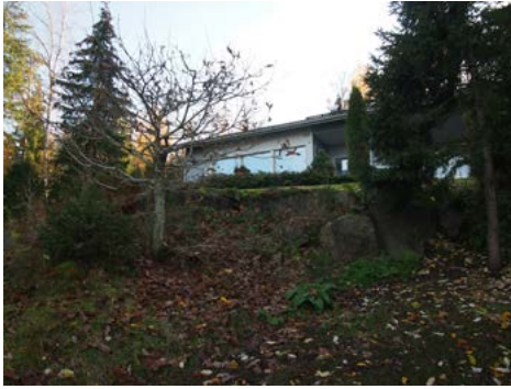
Kalliomäkien talo sulautuu keveästi Nunnavuoren rannan syysmaisemaan.