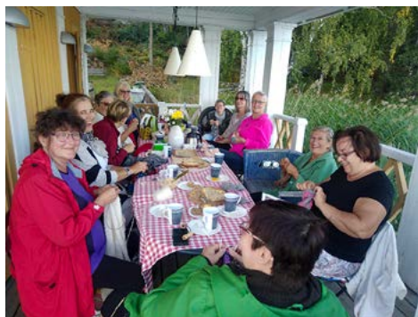
Neulomakerho Villa Vapparin terassilla

Valmiita töitä esitellään seuran muissa tapahtumissa ja osa kakskerta-aiheisista tuotteista on myös myynnissä.