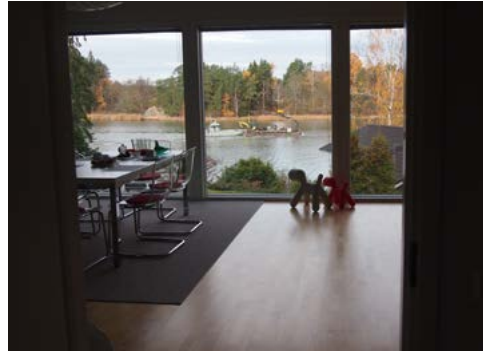
Olohuoneen maisemaikkunoista ja terassilta avautuu viehättävä näköala vastapäiseen Kulhon saareen.