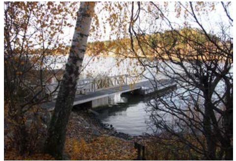
Pienet hyökyaallot eivät keinuttele betoniponttonin päällä kelluvaa jyvettä laituria.