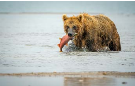
Onnistunut kalareissu; kuva Jukka Lämsä.

Jukka Lämsä oli saapunut kertomaan kuvin ja filminpätkien kera, millaista oli Venäjän Kamchatkalla tulivuori- ja karhuretkellä. Alue kokonaisuudessaan on hieman Suomea suurempi, mutta asukaita vain noin kaksi kertaa Turun verran eli väljyyttä on, kullekin asukkaalle riittää runsaat 1 km 2 maata. Teitä oli niukasti ja matkaa tehtiin helikopterilla ja maastoautoilla, välillä myös veneellä. Saimme olla mukana huimalla retkellä tulivuorten yllä, välillä lämpimien geysyirien äärellä ja lopulta mahtavien metsien kunninkaiden, karhujen, kanssa saalistamassa lohta. Kuulijoita oli tuvan täydeltä, melkein tungokseen asti.