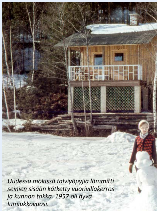
Uudessa mökissä talviviikkoja lämmitti seinien sisään kätetty vuorivillakerros ja kunnan takka. 1957 oli hyvä lumiukkovuosi.

Isä kulki ees taas rantamaastoon kaivettua montunrajaa ja ihasteli: tästä tulee mahottoman iso! ja äiti vannotti, että tuli minkälainen tuli, niin vaatekomoero sinne oli mahdutettava. Ei saatu komeroa. Muuten ei kamariin olisi mahtunut sänkyä.