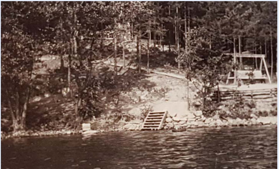
Järvenrantatonttimme ei ollutkaan aivan pystysuora, ja terassoimalla siihen sai mukavia oleskelupaikkoja.