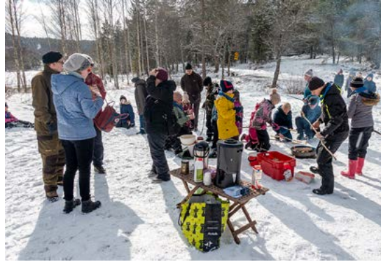
Tikkupullan paistoa partiolaisten rastilla.

Hennalaan kerääntyi monia saarilla toimivia yhdistyksiä Martinseurakunnan järjestämään talvimissiotapahtumaan. Ohjelmaa oli monen moista, erityisesti lapsille. Partiolaiset pitivät telttaleiriä, paistattivat tikkupullaa ja järjestivät leik-