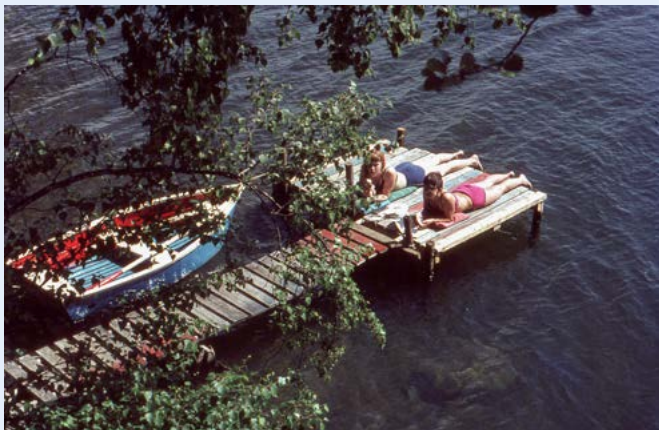
Laiturin vierellä kelluu kotitekoinen vaneriveneemme Titanic, joka pelastui upottamiselta

tia seuraavaan kokemiskertaan asti: kirvestä, marjapussia, hörriä (onkohan oikeasti olemassa sen niminen peli?), mitä hyvänsä ukki keksi opettaa apulaisilleen.