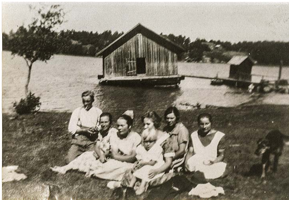
Rauhalan väkeä venerannassa.