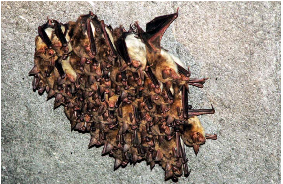
Talvehtivia isosiippoja Puolassa.

Lepakoilla pitää olla hyvä muisti ja paikallistuntemus, koska niiden ikä on 10-50 g painoiselle nisäkkäälle varsin huomattava, jopa yli 40 vuotta. Samanpainoiset nisäkkäät, päästäiset, hiiret ja myyrät elävät pari kolme vuotta maksimissaan. Lepakoita rengastetaan lintujen tapaan ja siksi ylipäätään tiedetään kauanko ne elävät. Syksyllä loka-marraskuussa lepakot hakeutuvat horrostuspaikkoihin, osa niiden liepeille, arimmat lajit jo niihin pysyvämmin. Kalliohalkea-