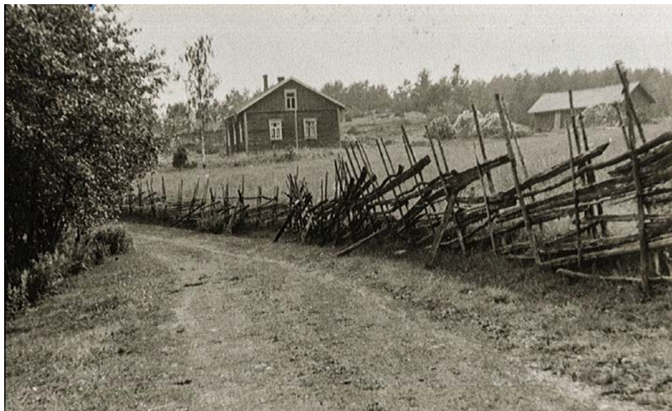
Rauhalan piharakennus.