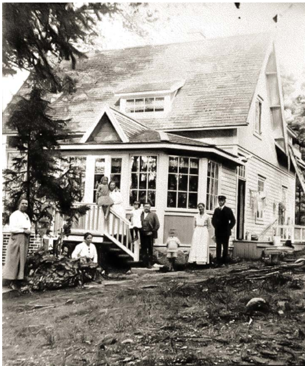
Pikku-Artukka erotettiin Länsitalosta 1910-luvun alussa.

huvilat. Jo aiemmin kylän maille oli muodostunut Lehtoniemen palstatila ja sen maille rakennettu Koirankarin huvila sekä Kaitaranta. Rakuunatorpat esiintyi-