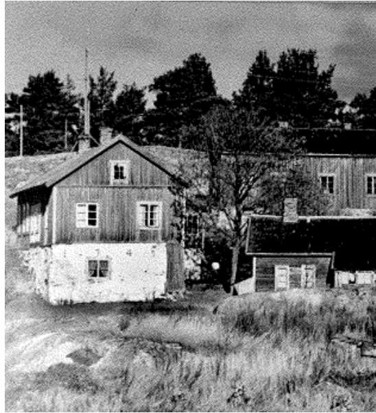
Itätalon sivurakennuksen kivijalkaan on merkitty vuosiluku 1748.