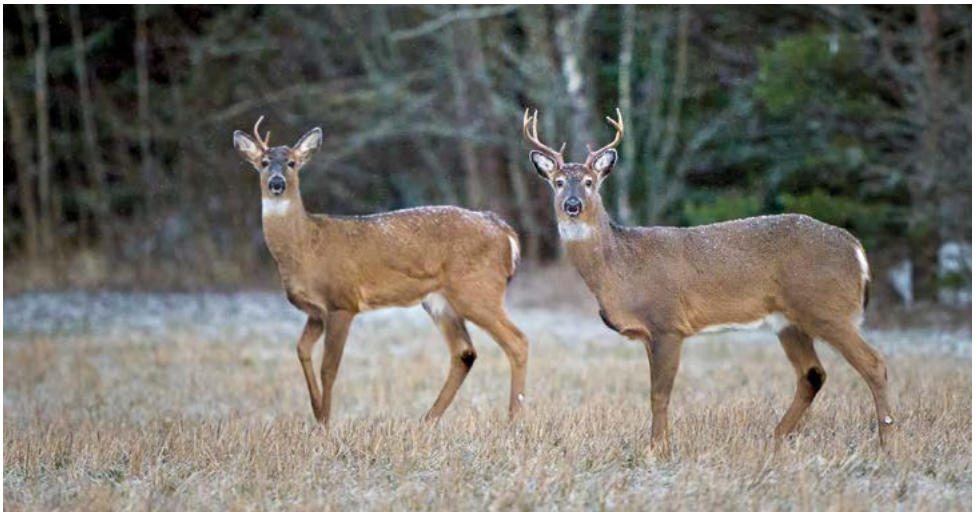
Kaksi valkohäntäpeurapukkia

Pienpetojen, etenkin vierastulokkaiden supikoirien ja minkkien, pyynti on ollut metsästysseuramme ohjelmassa kymmeniä vuosia. On kuitenkin hyvä tietää, että nykyään lähes kaikilla pienpedoillakin on rauhoitusaika, ainoastaan supi ja minkki ovat täysin rauhoittamattomia. Pitää myös muistaa, että laki ja etiikka kieltävät pyydystämästä eläinmoa, jota pienet pennut seuraavat. Näiden asioiden vuoksi keväällä ja alkukesällä ei pyyntivehkeitä vireessä pidetä. Kaksikerran Erällä on muutamia pienpeto- ja minkkiloukkuja, joita on sijoitettu paikallisten asukkaiden toivomuksesta pihapiiriin. Koska pyyntiloukut pitää joka