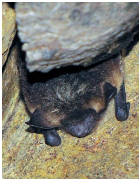
Kuvassa on yleisin lepakkomme pohjanlepakko, sen tunnistaa korvantyviä okranvärisistä korvoista.

Kaksikerran lepakkolajeista tiedän sen verran, että varsinkin vesisiippoja ja viikisiippoja sekä isoviikisiippoja saarella