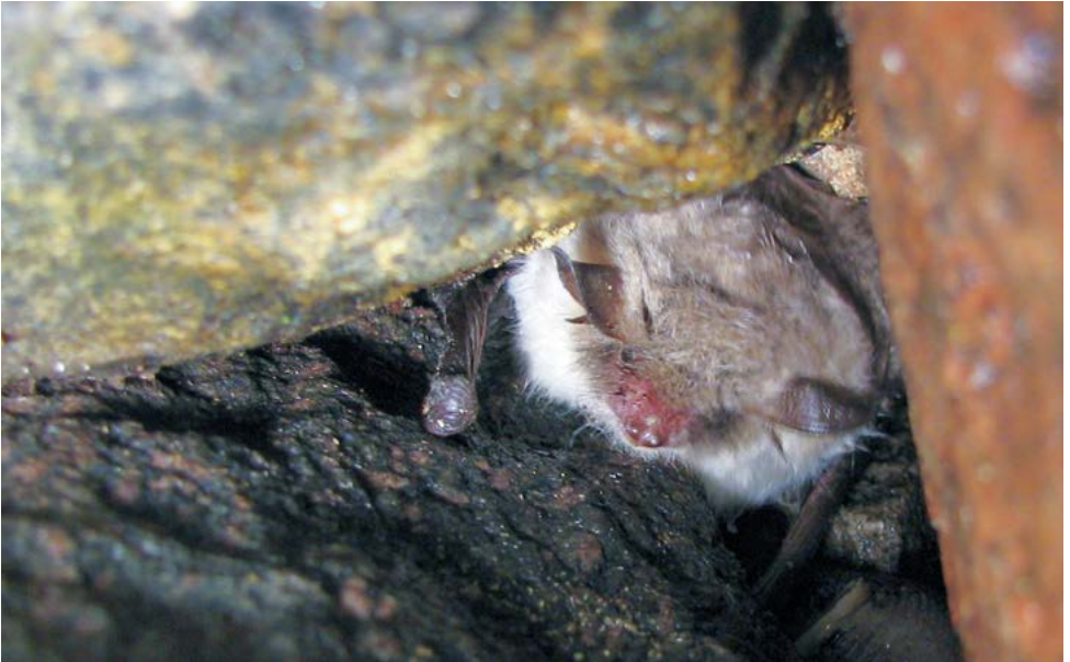
Harvinainen ripsisiippa, varsinainen tuntomerkki, ripset pyrstöpoimun reunassa, ei näy. Laji on toinen, jolla on vitivalkoinen maha kimolepakon lisäksi. Kimolepakolla olisi pienet ja mustat korvat.

Suomessa on varmuudella tavattu 13 lepakkolajia ja lisäksi ainakin yksi laji,