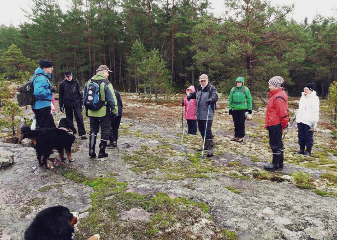
Kuva viime vuoden patikkaretkeltä; Kuva: Jarkko Koskinen.