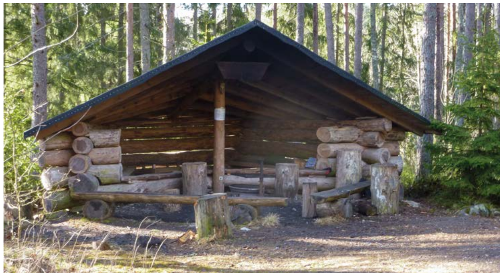
Hyyritilän laavu saarelaisten käytössä; toimii pyyntiaikana myös metsästäjien tukikohtana; Kuva Sakari Itähaarla.

päivä käydä tarkastamassa, pihapiirissä se käy kätevästi asukkaiden toimesta.