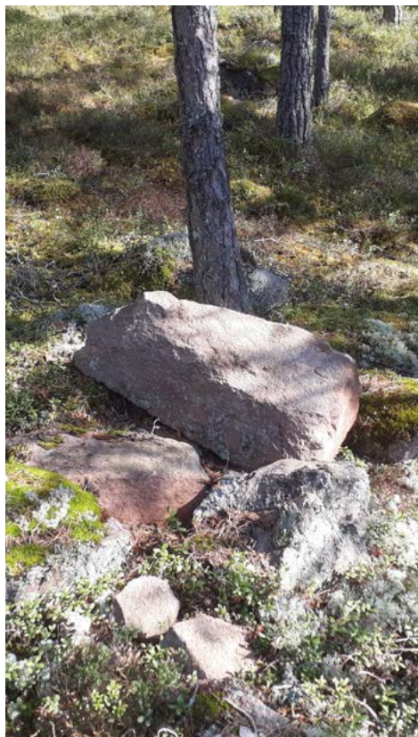
Kaadettu rajakivi; Kuva Raimo Västinsalo.

Muistakaa nauttia ainutlaatuisesta luonnostamme.