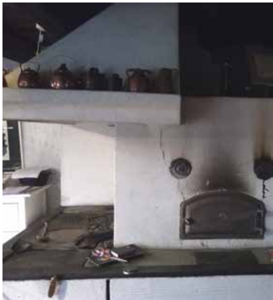
Rakuunantorpan tuvan vanha leivinuuni, joka edelleen palauttaa mieleen kahvitorpan iki-ihanan tunnelman, josta tultiin nauttimaan pitkien matkojen takaa 40 vuoden ajan.

lämmitykseen. Kahvitorpan kävijöiden muistoissa monella lienee juuri tuon hienon suuren leivinuunin luoma tunnelma. Uuni kun täyttää ¼ koko huoneesta! Onnellinen oli hän, joka löysi aikanaan istuinpaikan sen viereltä kahvikupposesta nauttiessaan. Kahvilatiskin takana ollut entinen matala keittiöpuoli (ja ennen sitä ehkäpä jopa kotieläinten asuinpaikka, maalattiainen kun lienee ollut, arvelee isäntä) on edelleen keittiötilana, nyt korotettu, kuten sisäkattokin, joka on kauniisti laudoitettu uusin taotuin nauloin. Suihkuhuone mukavuuskin täydentää uudistukset.