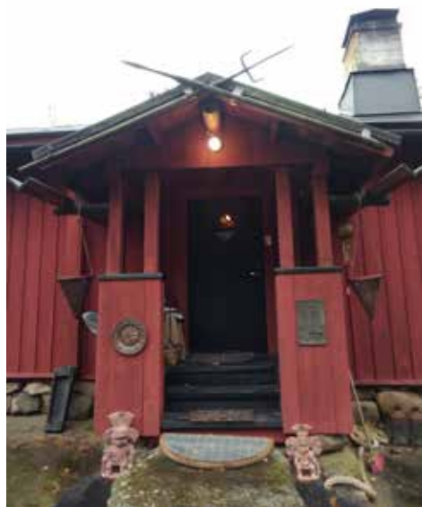
Rakuunantorpan uusi perinteinen sisääntulokuisi, isännän "vajalöytöinä" harjalla mahdollisesti entisen rakuunan työvälineiden kopioita tai sitten ehkä hylkeenpyyntivälineitä? Kauniit puiset vesikourut ovat perinteisen mallin mukaisia.

Asuminen tässä vanhassa arvotorpasa vaikuttaa varsin kotoisalta ja toimivalta. Olisi tehnyt mieli, mutta enpä rohjennut kysyä, josko uusi isäntä on edes vähän miettinyt kahvi- ja munkkitarjoilua aloitettavaksi uudelleen, vaikka sen tuun suuren vanhan pihakuusen alla.