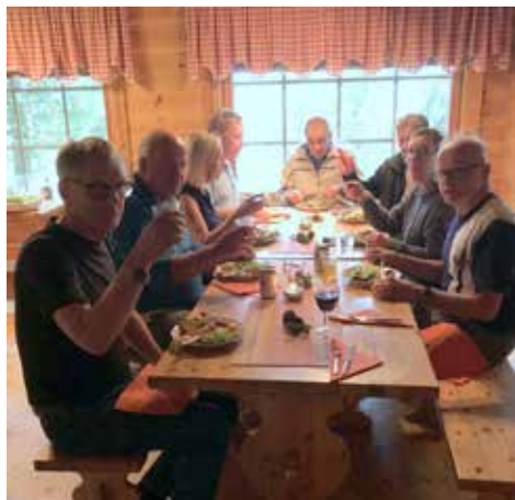
Discon 50 v juhla-ateria.