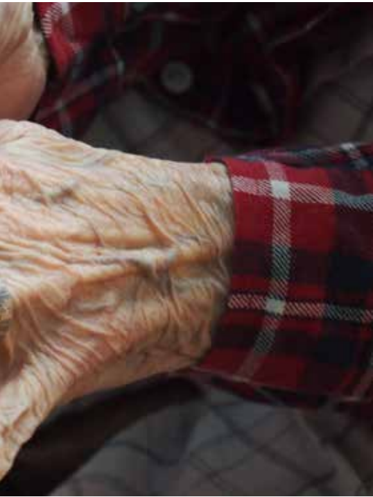
Ajan muovaamat, kauniit, työteliäät kädet.

Evän kotimatka sujui linja-autolla, myöhemmin työstä päässyt Niilo tuli illan suussa autollaan Kollin rantaan salmen yli soudettavaksi.