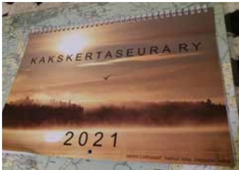
Kalenterin kansikuva, Aamun lintu Vapparin selällä.

Kaks kertaseuran ja Kaks kertatalon sääntömääräiset vuosikokousasiat tuli hoidettua. Kaikki sujui odotetusti, vastuu vapaudet myönnettiin, suunnitelmat tulevalle vuodelle hyväksyttiin ja henkilövalinnoissa kaikille kirjattiin jatkokaudet.