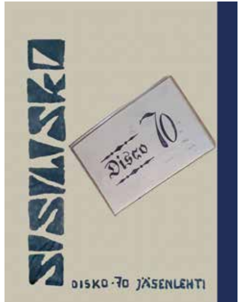
Porukan äänenkannattaja, Sisilisko.

Toiminnan kannalta tärkeää oli luoda omat säännöt, hallitus, ym. Jäsenmaksu oli 5 mk kuukaudessa. Sillä sai oman avaimen, koska tämä oli suljettu yhteisö.