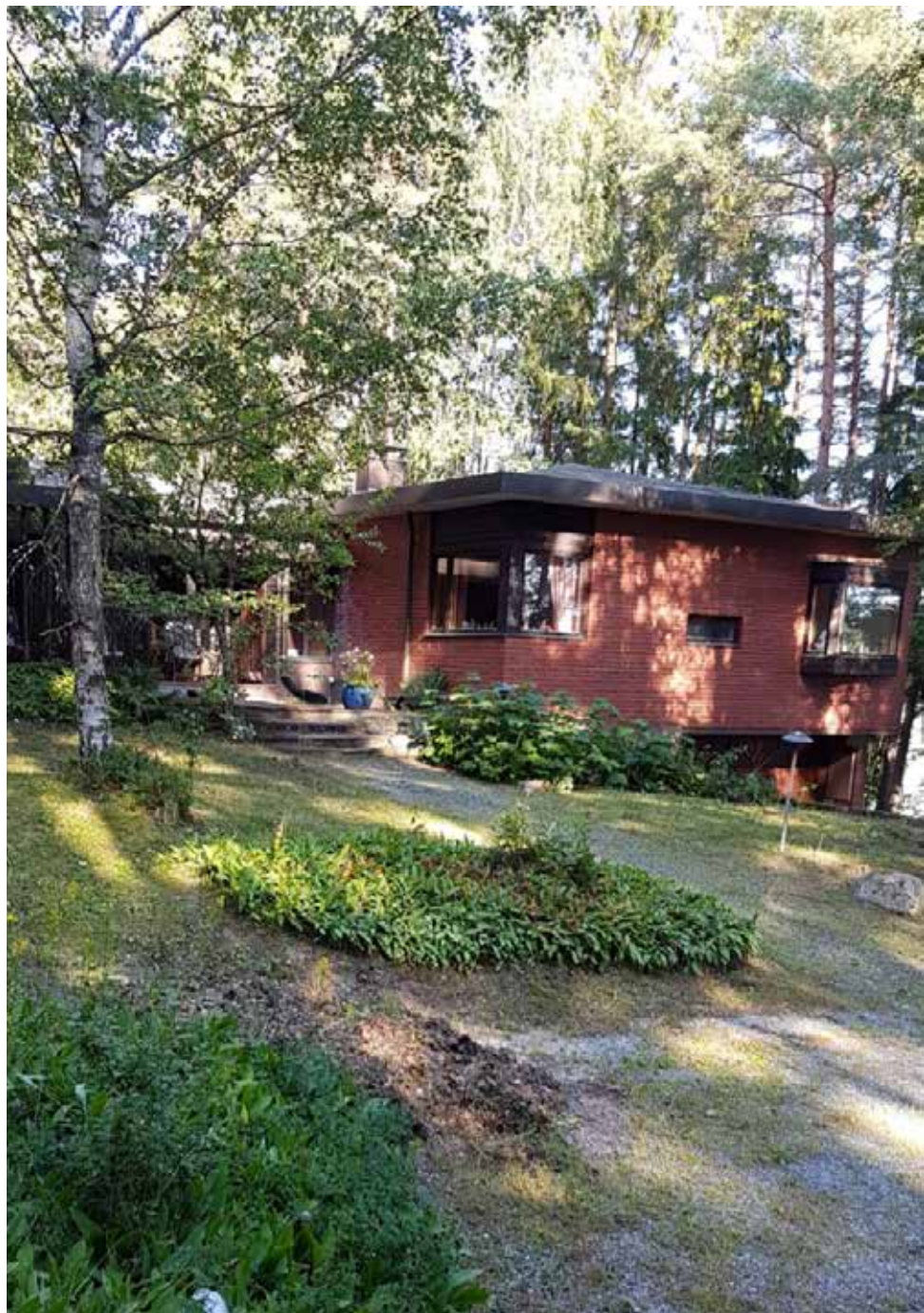
Eeva ja Niilo rakensivat Kollin maille omakotitalon.