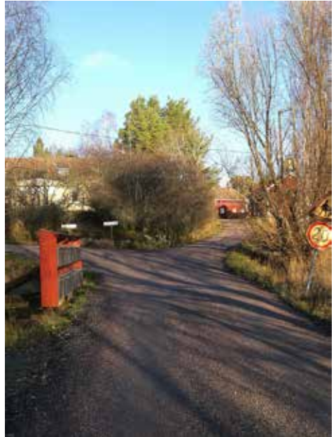
Artukan kyläraittia.

Koulunkäynnin, opiskelun ja työelämän myötä siteet Artukkaan jäivät aina vain vähäisemmiksi, mutta tietenkin olen seurannut, miten sinne muuttaa uusia perheitä. Itselläni on aina kesällä tilaisuus virkistää vanhoja muistoja mökillä. Tunneside Artukkaan säilyy aina kaikkein voimakkaimpana missä sitten ikinä asuukin.