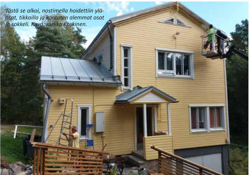
Tästä se alkoi, nostimella hoidettiin yläosat, tikkailla ja kontaten alemmat osat ja sokkeli.

Talon maalausremontti pääsi monen vuoden odottelun jälkeen alkamaan. Ensinnä pestiin seinät ja sitten alkoi maa-