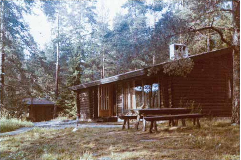
Muurahaissaaren mökillä viihdyttiin koko kesä.