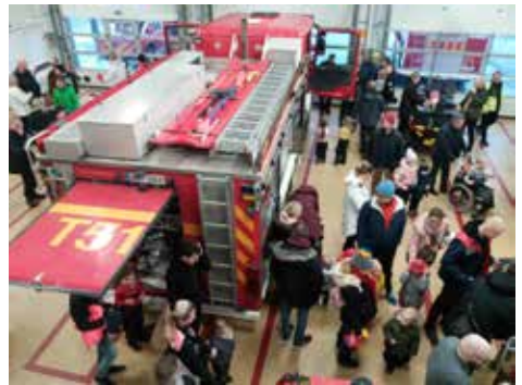
Yleisömenestystä paloautohallissa.

VPK:n toiminta ahtaissa ja epätarkoituksenmukaisissa parakkitiloissa Harjattulassa päättyi uuden paloaseman valmistuttua Kaks kertantien ja Erikvallantien risteykseen, optimaaliseen paikkaan saarten eri osia ajatellen. Avoimet ovat keräsivät runsaasti tutustujia, erityisesti lapsiperheitä.