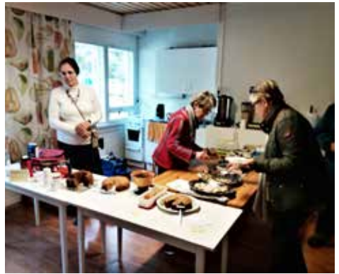
Ensin suolaista, sitten makeaa ja kaikille riitti.

Sadonkorjuupäivää vietettiin perinteiseen tapaan Kakskertatalolla. Tarjolla oli kulttuuri- ja toimintatyöryhmän tekemiä suolaisia syötäviä, joissa teemana olivat kalat, ja jälkiruokana makeat leivonnaiset. Esillä oli myös paikallisten kädentaitajien töitä ja tuotteita, joita saattoi sekä ihastella että ostaa. Väkeä kävi kiitettävästi, turvaetäisyydet pääsääntöisesti huomioiden.